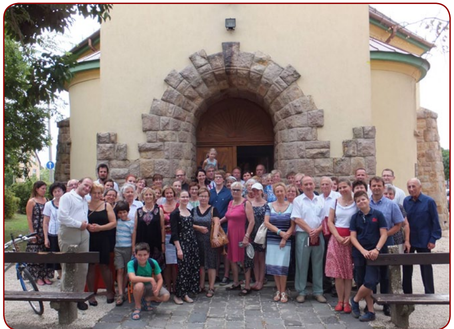
Ühispilt Forssa, Gődöllö ja Kaarli koguduse rahvaga

Kui pärast pikka ja meeleolukat päeva ööbimiskohta jõudsime, oli uni imeline. Laupäeval külastasime Gődöllö lossi ja seejärel ootas meid muusikakoolis suu-