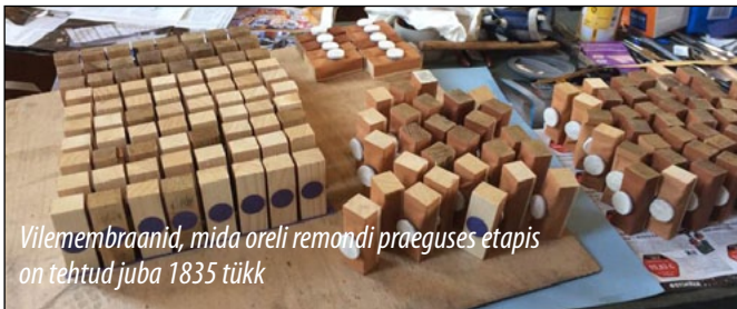
Vilemembraanid, mida oreli remondi praeguses etapis on tehtud juba 1835 tükk