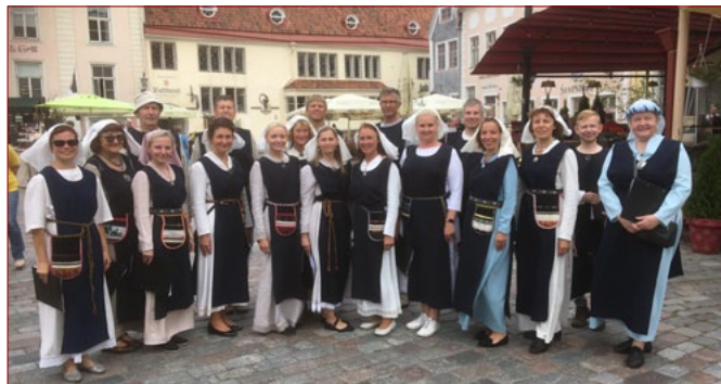
Kaarli koguduse oktett ja kammerkoor Canorus esinesid Raekoja platsil Keskaja Päevadel. 15.-16. august