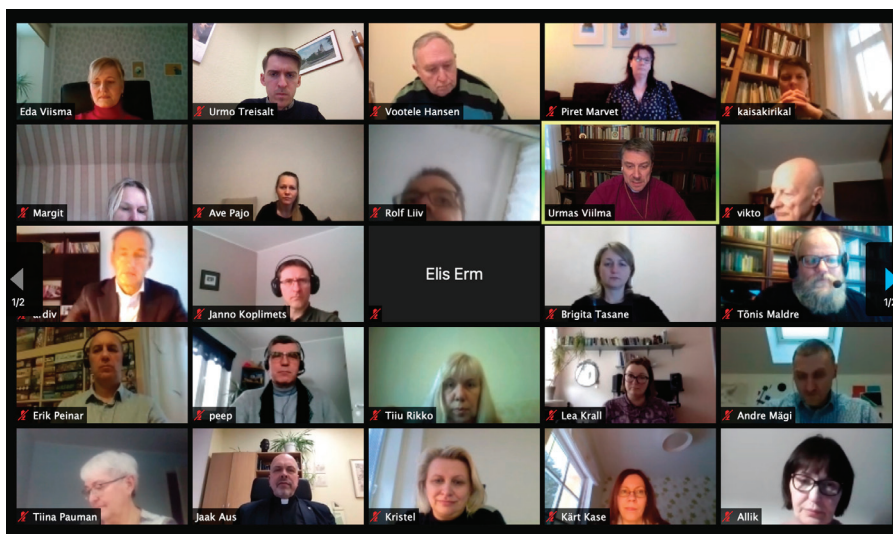
Kuvatõmmis koguduse nõukogu ZOOM koosolekult