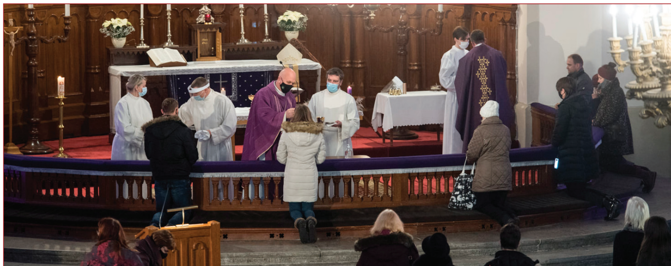
Missa 20. detsembril, mil olime maski kandmise ja distantsi hoidmisega juba harjunud.

meannetajaid oli möödunud aastal 1725 (2019. aastal oli 1776). Kõige suurem osa annetajatest on 45–64 aastased (549 inimest). Keskmine annetuse suurus oli 89 €.