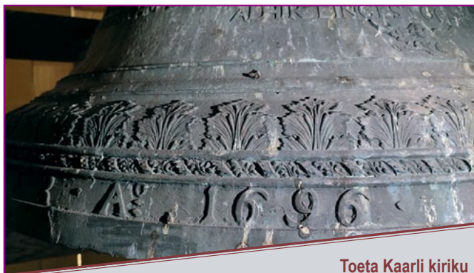
Toeta Kaarli kiriku restaureerimistöid

Oleme tänulikud kõigile, kes soovivad remonditöid toetada helistades koguduse annetustelefoninumbri 900 7755 (5 €) või pangaaulekandega (EELK Tallinna Toompea Kaarli kogudus, Swedbank EE902200221040614950 märksõna "Kiriku remont")