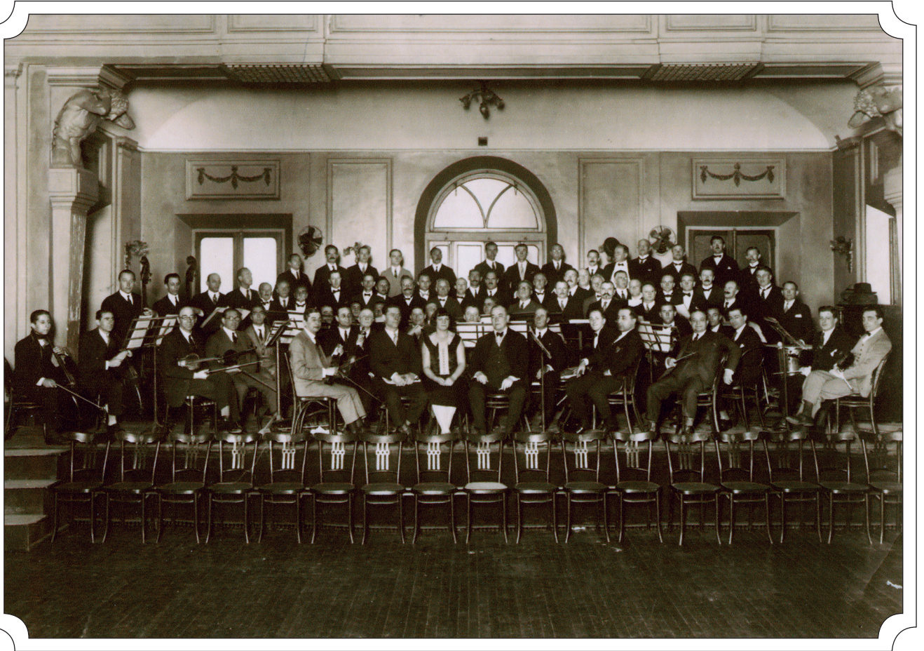
Argentiina Eesti seltsi orkester Buenos Aireses, 1925.

Nii sai alguse Kaarli kirikukontsertide traditsioon, mis kestab muusikaõhtute näol tänaseni.