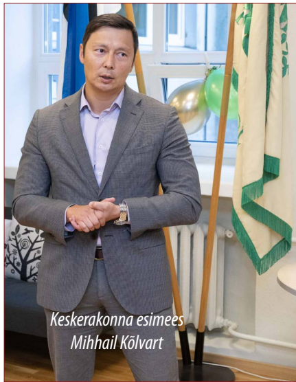
Keskerakonna esimees Mihhail Kõlvart

Iga juurdeehitus on avalik, tähtis on vundament. Kui vundament on tugev, siis neid juurdeehitusi tuleb veel ja veel. Ja seda ma ka teile soovin.“