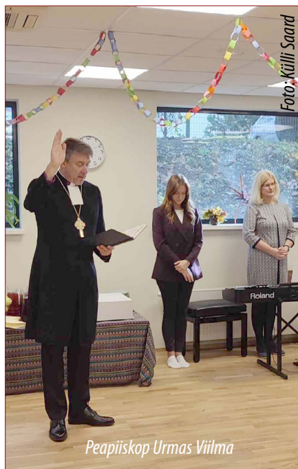
Peapiiskop Urmus Viilma

Tänane kuupäev on tähenduslik, kuna Kaarli lasteaial täitus täna 30 aastat.