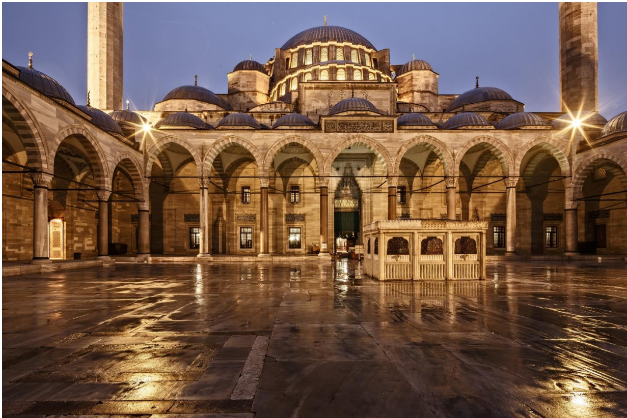
Sülemaniye mošee õu

Õhtupoolikul on soovijail võimalus külastada Sülemaniye mošeed , mis on sultan Süleyman Toreda (võimul 1520-1566) ja tema peaarhitekti Sinani matusepaik.