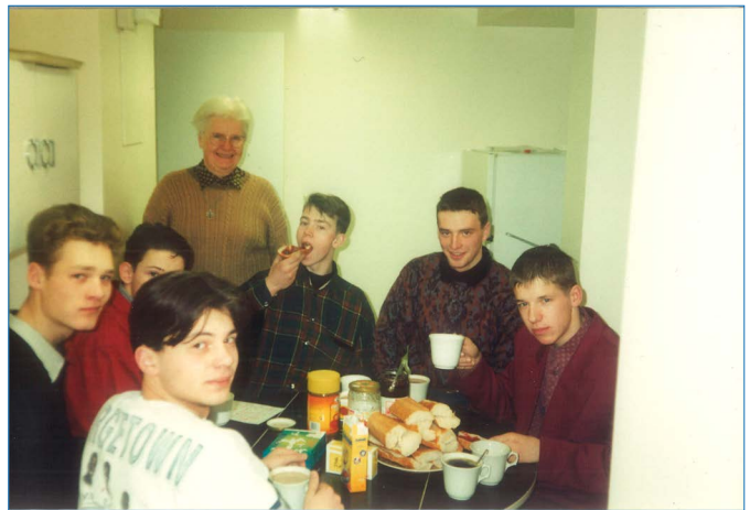
Hommikusöök Paris is 1994. aastal