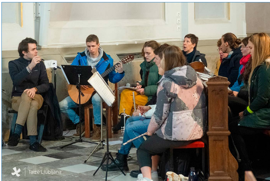
Koor ja orkester Ljubljana kohtumisel 2023. aastal

vabatahtlike vastuvõtt, info jne. Need tööd hakkavad juba 14. detsembrist.