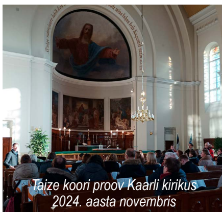
Täize koori proov Kaarli kirikus 2024. aasta novembris

Nagu näha on vabatahtlikele vägagi erinevaid ülesandeid ja loodetavasti leiab igaüks, kes vabatahtlikuna kokkutuleku õnnestumisele kaasa idata tahab endale jõukohase ja huvitava ülesande.