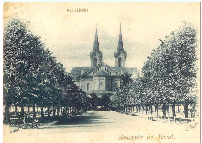
Postkaart aastast 1889